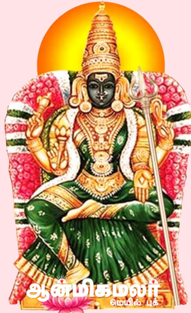
ஆன்மிகமலர் மெயில் புக

கோபத்துடன் காட்சியளிக்கும் காளி, தூர்கை, வீரபத்திரர், உக்கிரநரசிம்மர் போன்ற விக்கிரகங்கள் "உக்கிர மூர்த்திகள்" என்று அழைக்கப்படுகின்றன.